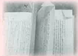
ページの角を折られた本