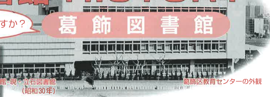
葛飾区教育センターの外観

葛飾区最初の図書館である葛飾図書館は、昭和24(1949)年に、本田町17番地に開館しました。面積90㎡、蔵書3,000冊からのスタートでした。