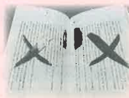
書き込みされた本

水濡れのほかにも、切り抜き・書き込み・ページの角を折られた本など、汚損・破損の状態になって返却されるものもあります。汚損・破損の程度によっては、弁償をお願いすることもあります。