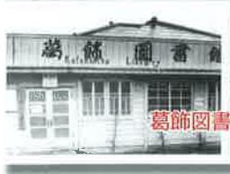
葛飾図書館-現・立石図書館 (昭和30年)