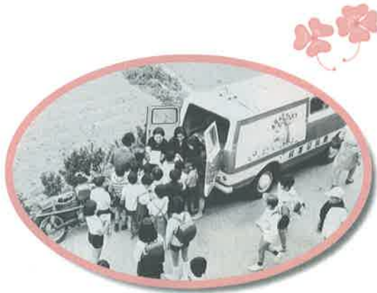
配本車での貸出サービス光景(昭和44年)

昭和44(1969)年6月には、「電話1本で本の出前！」をキャッチフレーズに、区内のすみずみにまで読書の機会を提供する配本車の活動が始まりました。区立図書館が2館しかない時代だったため、利用者にたいへん喜ばれました。