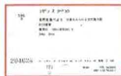
← オンラインシステム化以前の目録カード

現在、葛飾図書館の施設は新宿図書センターと名称変更し、地区図書館と区内所蔵資料の保存庫、区内の学校への支援コーナーとして引き続き活躍しています。