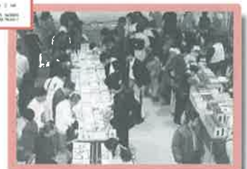
リサイクル市の様子 (平成8年) →