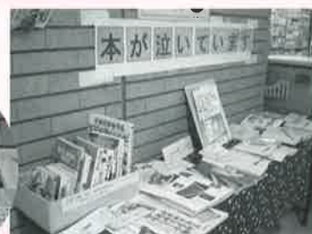
鎌倉図書館での様子