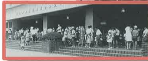
← 親子映画会当日の光景