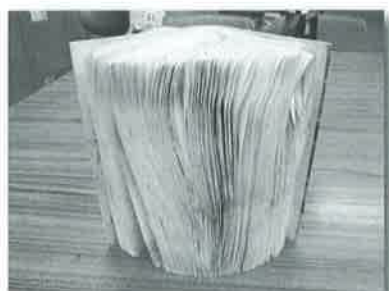
水濡れのため、利用できなくなっ てしまった資料